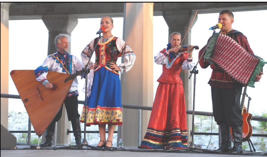
El Conjunto ruso Barynya, que ha sido un favorito de la Noche Internacional, regresa a la cuarta serie anual el miércoles, 27 de julio.

Cuarta serie anual de la Biblioteca Internacional de la Noche con música, la danza de las culturas de todo el mundo