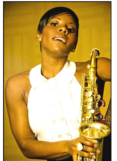
Dinámico saxofonista Tia Fuller la principal atracción el 11 de agosto en el programa de Jazz en la