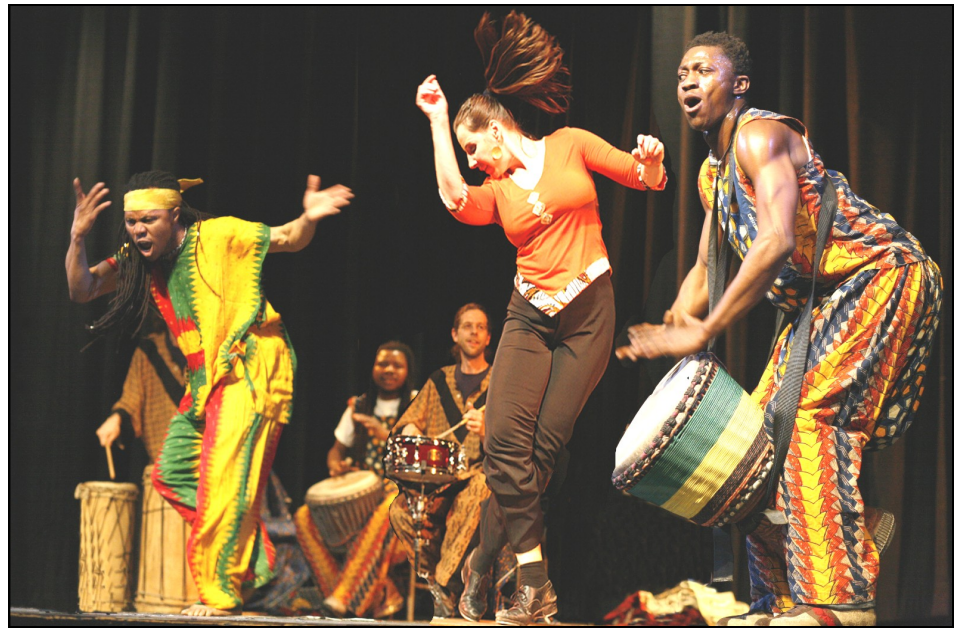
Feraba interpretará música de África Occidental, canto y danza el 3 de agosto como parte de la serie Noche Internacional.

Inglés Intermedio 1 a 4 pm los lunes del 11 de julio al 29 de agosto. — Esta es una clase general de aprendizaje de Inglés y se incluye gramática, vocabulario, ejercicios de comprensión auditiva, lectura, escritura, textos de referencia y pruebas.